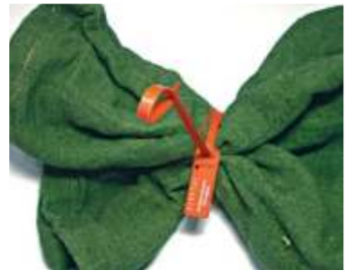
“ ” 6 ”