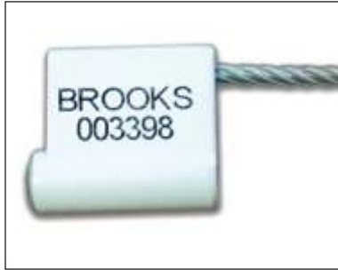
“ ” 2000”