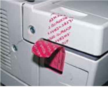
6 “ ”