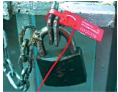
“ ” 6 ” / “ 6 ”