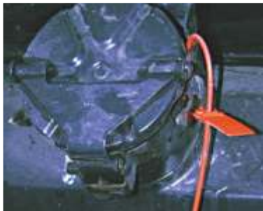
“ ” 3.8”