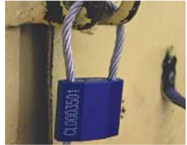
“ ” 2.5”