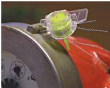
“ ” ”